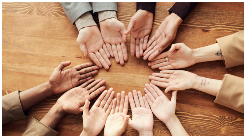
Figura 10: A aplicação dos valores humanos.

Além do ODS 3, outras metas globais, como o ODS 6 - Água Limpa e Saneamento e o ODS 13 - Ação Climática , impactam diretamente a saúde das populações e são exemplos de como a prática profissional na área da saúde pode se expandir para além dos consultórios, contribuindo para a sustentabilidade ambiental e o bem-estar coletivo.