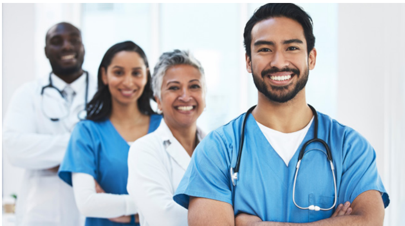
Figura 9: Trabalhar em equipe.

Por exemplo, ao discutir um caso clínico, é importante que o profissional compartilhe apenas as informações necessárias com a equipe, protegendo a privacidade do paciente. Além disso, o respeito à diversidade de opiniões e abordagens é um valor ético que deve ser incorporado no dia a dia, reconhecendo que cada disciplina tem um papel único no cuidado integral do paciente.