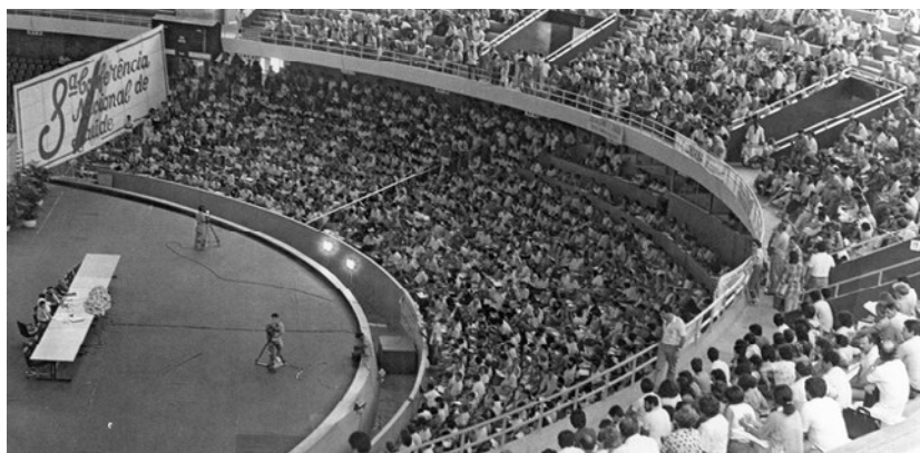
Figura 5: 8ª Conferência Nacional de Saúde.