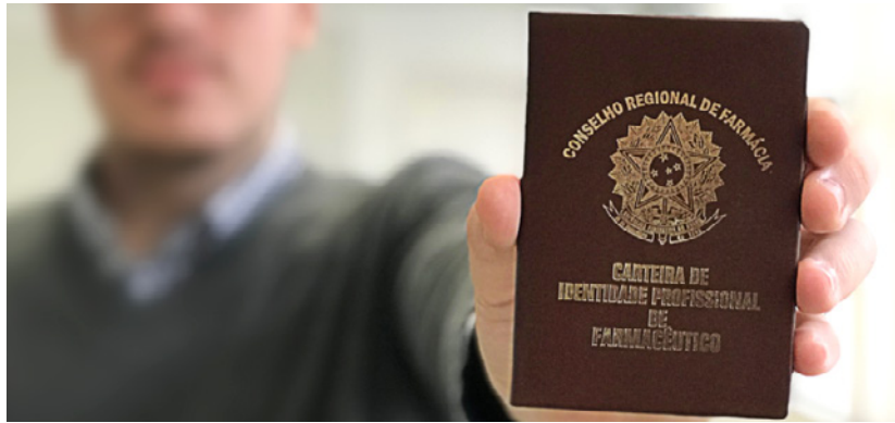
Figura 12: Carteira de Identidade Profissional de Farmacêutico.

Ao se registrar no conselho de sua área, o profissional passa a ser fiscalizado por essa entidade, que monitora a conduta ética e o cumprimento das normas de atuação. Esse monitoramento assegura que as práticas sejam realizadas de forma responsável e em conformidade com os padrões legais e éticos estabelecidos.