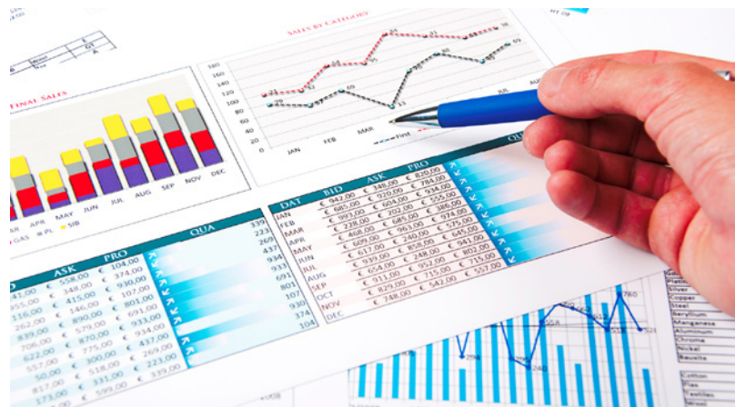
Figura 4: Atender a metas financeiras ou institucionais.

Um exemplo de dilema moral em contextos profissionais de saúde pode ocorrer quando um profissional é incentivado a recomendar ou aplicar tratamentos mais longos ou mais caros para atender a metas financeiras ou institucionais, mesmo que o paciente já tenha alcançado uma melhora significativa. Nesse caso, a prática pode ser incentivada dentro daquela instituição ou ambiente, uma vez que ela está de acordo com as regras comerciais vigentes. No entanto, o profissional de saúde deve compreender que essa conduta é imoral, pois prioriza o lucro ou outros interesses acima do bem-estar do paciente, criando um conflito entre seguir as normas estabelecidas e agir de acordo com seus princípios morais e éticos de cuidar do paciente da forma mais responsável e justa possível.