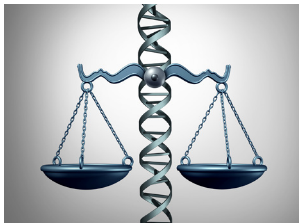
Figura 3: A justiça e a bioética.

Esses costumes, no entanto, podem variar significativamente de uma cultura para outra, e até mesmo dentro de uma mesma sociedade ao longo do tempo. O que é moralmente aceito em um período histórico pode ser amplamente questionado em outro.