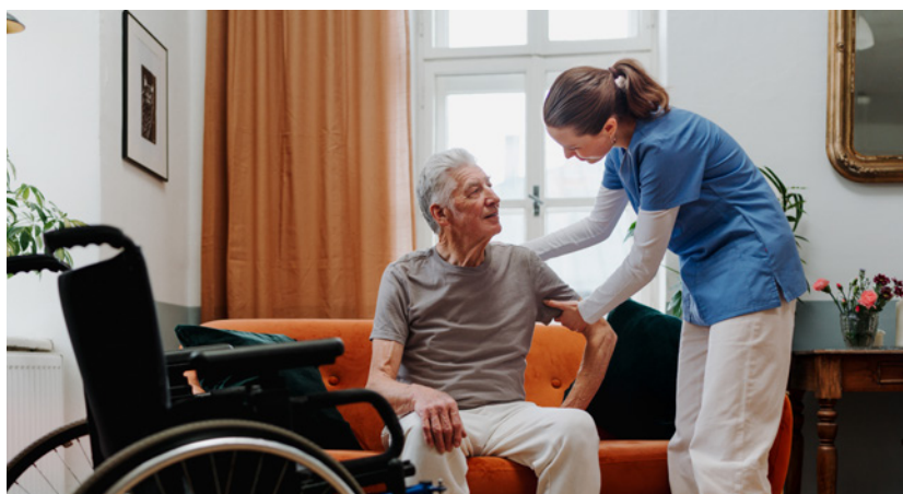
Figura 8: A prática da saúde: cuidado, empatia e dignidade.

Os valores humanos são fundamentais para a prática da saúde, e entre os mais importantes estão o cuidado, a empatia e o respeito à dignidade . Esses valores orientam a relação entre o profissional de saúde e o paciente, criando uma conexão que vai além do tratamento técnico, envolvendo também o respeito às necessidades emocionais e psicológicas do indivíduo. Cuidar de uma pessoa requer mais do que habilidades clínicas; exige um entendimento profundo da vulnerabilidade do paciente, garantindo que ele seja tratado com compaixão e respeito, independentemente de sua condição.