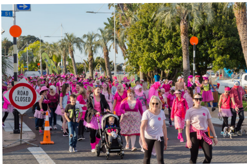
Figura 1: Pessoas unidas pelo exercício dos direitos e deveres em uma sociedade democrática.

É essencial compreender as diferenças e inter-relações entre esses conceitos para atuar de maneira consciente e responsável em nossos papéis sociais e profissionais. A ética lida com valores e princípios de conduta universais, enquanto a moral se refere aos costumes e hábitos compartilhados por uma comunidade específica. A cidadania envolve o engajamento social, político e ético, promovendo a participação ativa no processo democrático.