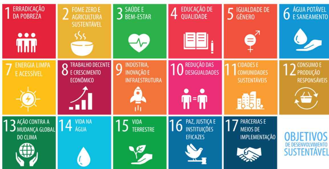
Figura 11: 17 Objetivos de Desenvolvimento Sustentável da ONU.

Além do ODS 3, outras metas globais, como o ODS 6 - Água Limpa e Saneamento e o ODS 13 - Ação Climática , impactam diretamente a saúde das populações e são exemplos de como a prática profissional na área da saúde pode se expandir para além dos consultórios, contribuindo para a sustentabilidade ambiental e o bem-estar coletivo.