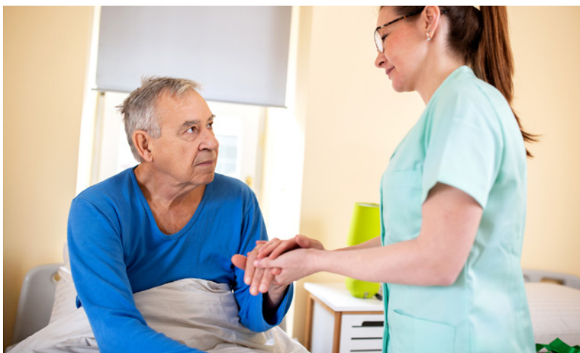
Figura 2: O profissional de saúde colocando o bem-estar do outro como prioridade.

O compromisso ético exige que o profissional de saúde coloque o bem-estar do outro como prioridade, equilibrando suas próprias convicções com as demandas de seu papel social e profissional. Dessa forma, a ética funciona como um guia para assegurar que as ações sejam tomadas com responsabilidade e sempre em favor da saúde e da dignidade do paciente.