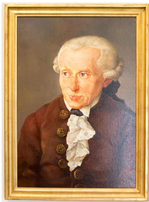
Figura 1: Immanuel Kant.

A deontologia é um dos pilares fundamentais da ética profissional na área da saúde. Sua origem remonta aos estudos filosóficos de Immanuel Kant, que defendia o cumprimento dos deveres morais como uma expressão de respeito pela dignidade humana. A deontologia, assim, não se limita a um conjunto de regras; ela busca estabelecer princípios de conduta que respeitem o outro como um fim em si mesmo, independentemente das circunstâncias. No contexto da saúde, esse enfoque na ética dos deveres oferece uma estrutura sólida para os profissionais atuarem de maneira justa e responsável, colocando o bem-estar do paciente e os princípios de responsabilidade social no centro de suas ações.