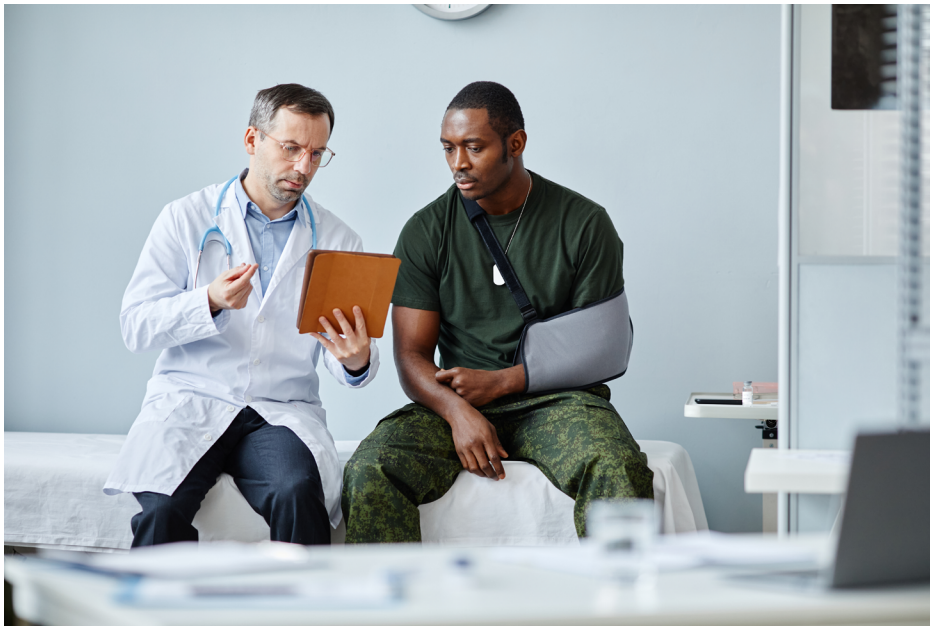
Figura 3: Profissional de saúde e seu paciente.

Legenda: A imagem mostra uma consulta médica entre um médico e um paciente. O médico, vestido com um jaleco branco, está segurando um tablet e parece estar examinando os resultados de exames ou anotando informações sobre o paciente. O paciente, vestido com roupas casuais, está sentado em uma cadeira e parece estar conversando com o médico.