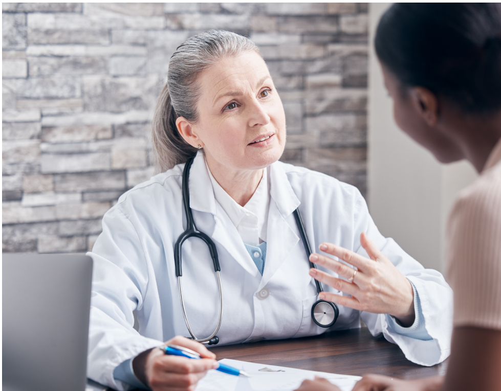
Figura 5: Profissional de saúde e paciente.

Esse compromisso ético inclui a transparência e a comunicação honesta . Para que o paciente possa exercer sua autonomia, ele precisa ter informações claras sobre seu diagnóstico, tratamento e possíveis consequências de cada decisão. A deontologia exige que o profissional de saúde seja sincero e direto, compartilhando com o paciente os prós e contras de cada opção terapêutica, para que ele possa fazer uma escolha informada. A omissão de informações importantes, a simplificação excessiva ou até mesmo o uso de linguagem técnica para confundir ou impressionar o paciente são atitudes contrárias aos princípios deontológicos. A transparência fortalece a confiança, um elemento essencial nessa relação, e assegura que o paciente compreenda que o profissional está comprometido com sua saúde, sem interesses ocultos.