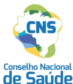
Figura 7: Conselho Nacional de Saúde.

O Conselho Nacional de Saúde (CNS), órgão de controle social do SUS, desempenha um papel estratégico na definição das diretrizes bioéticas que orientam o sistema público de saúde no Brasil. Além de ser responsável por formular políticas de saúde, o CNS também atua na fiscalização e no monitoramento das ações do SUS, garantindo que os princípios éticos sejam efetivamente aplicados na prática. Esse órgão promove um ambiente de discussão e análise ética que orienta as decisões políticas de saúde pública, assegurando que os valores de universalidade e equidade sejam mantidos como prioridades no atendimento e nos programas de saúde.